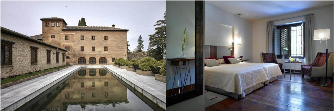
5* Hotel Colón Gran Meliã 塞維亞位於歷史中心