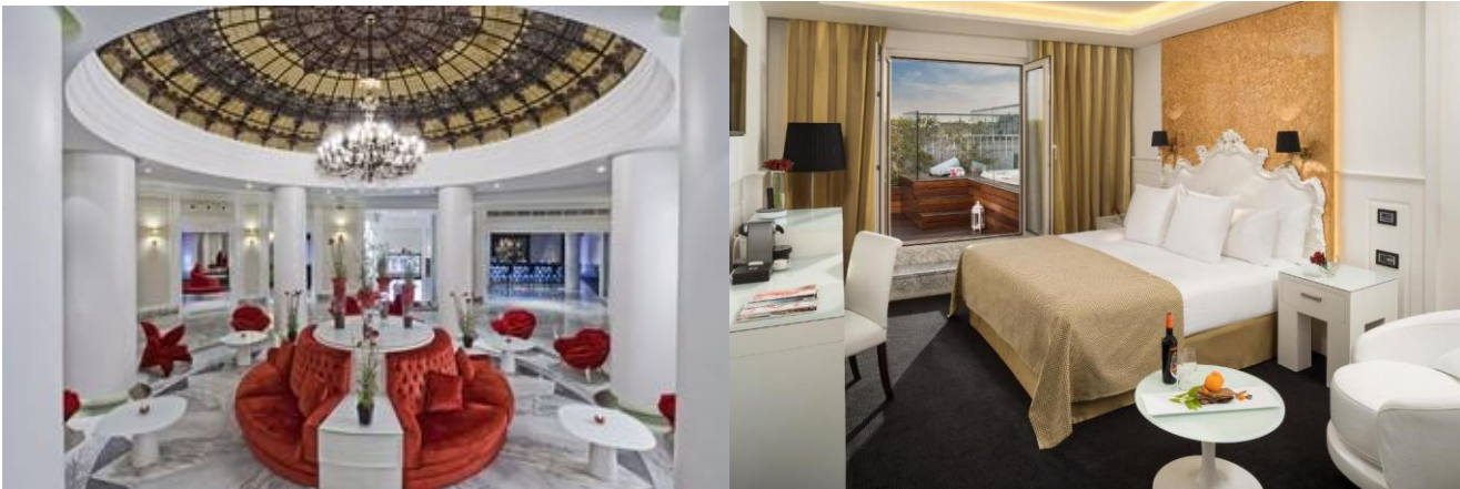
5* The Westin Valencia